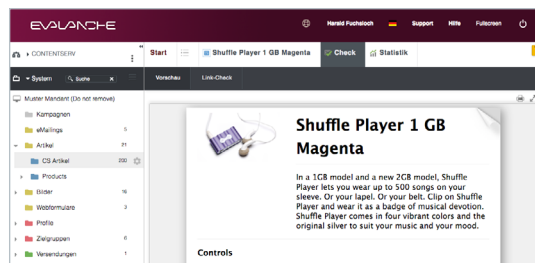
Aus den Contentbausteinen werden automatisch die Artikel generiert oder aktualisiert