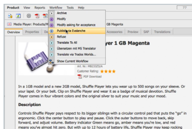
Alle benötigten Daten, inklusive Bilder, an Evalanche übertragen oder aktualisieren